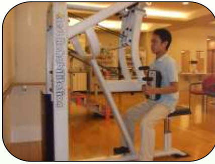
上肢の筋力の維持・強化