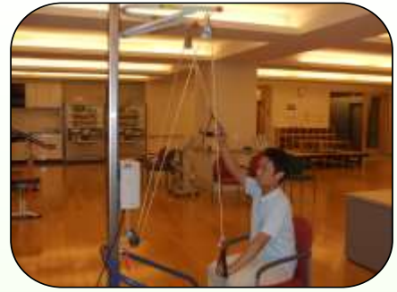
上肢の可動域訓練