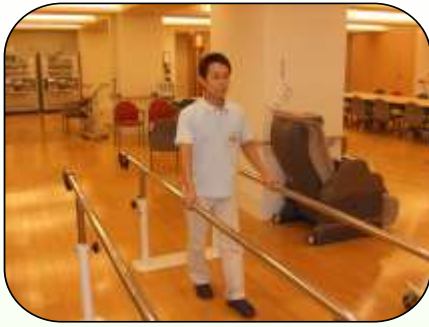
平行棒での歩行訓練